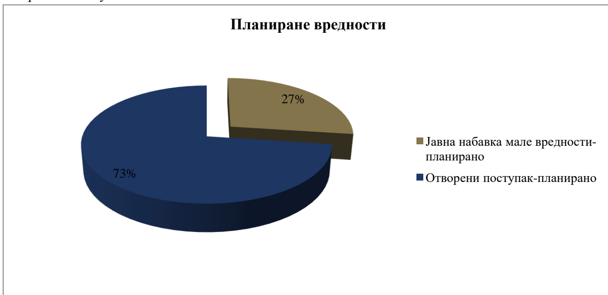
Табела број 5: Преглед поступака јавних набавки по плану јавних набавки за 2019. и 2020. годину, који су окончани закључењем уговора до 31.12.2020. године